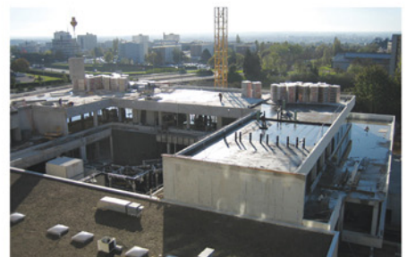
8 novembre 2005 - 11h08