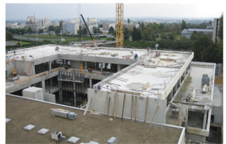
24 octobre 2005 - 15h32