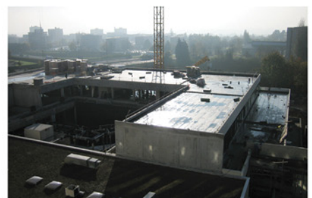
22 novembre 2005 - 11h15