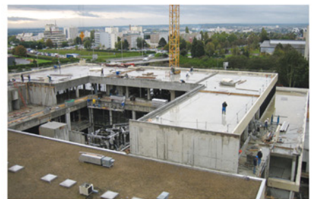
2 novembre 2005 - 10h33